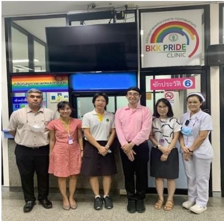
รูปที่ 3 การเปิดให้บริการคลินิกสุขภาพเพศหลากหลาย (BKK pride clinic)

คลินิกสุขภาพเพศหลากหลาย (BKK Pride Clinic) ได้เปิดให้บริการอย่างเป็นทางการ เมื่อวันที่ 12 กรกฎาคม พ.ศ. 2565 โดยในช่วง 6 เดือนแรก เปิดให้บริการทุกวันอังคาร เวลา 8.00 - 12.00 น. หลังจากนั้นได้มีการขยายบริการเพื่อเพิ่มการเข้าถึงของผู้มารับบริการได้อย่างสะดวก โดยเปิดให้บริการทุกวันจันทร์ - ศุกร์ เวลา 08.00 - 12.00 น. เว้นวันหยุดราชการ ดังรูปที่ 3