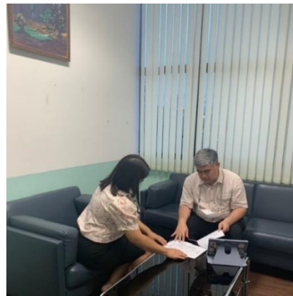
รูปที่ 5 การประเมินผู้มารับบริการ โดยนักจิตวิทยา

2. ร่วมดูแลโดยการประสานงานแบบไร้รอยต่อ โดยผู้เชี่ยวชาญแต่ละด้านตามความต้องการและปัญหาของผู้มารับบริการแต่ละคนอย่างจำเพาะเจาะจง โดยมีการให้บริการในด้านต่าง ๆ ได้แก่