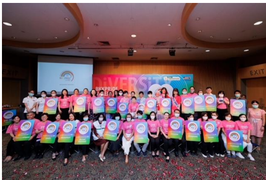
รูปที่ 2 การสร้างภาคีเครือข่ายกับผู้ที่มีความ ความหลากหลายทางเพศ

2. กลุ่มงานอื่น ๆ ที่เกี่ยวข้อง โดยการประสาน ความร่วมมือเพื่อกำหนดแนวทางต่าง ๆ ดังนี้