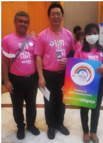
รูปที่ 1 การสร้างภาคีเครือข่ายนำโดย รองผู้อำนวยการสำนักการแพทย์ และทีมนักจิตวิทยา

6) การสร้างภาคีเครือข่ายกับกลุ่มผู้ที่มีความหลากหลายทางเพศเพื่อความเข้าใจปัญหา และสร้างแนวทางให้ผู้มารับบริการเข้าถึงได้อย่างตรงจุด ดังรูปที่ 1 และ 2