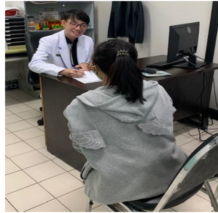
รูปที่ 4 การดูแลผู้มารับบริการ โดยจิตแพทย์

1. ผู้มารับบริการในคลินิกสุขภาพเพศหลากหลาย (BKK Pride Clinic) ทุกรายจะได้รับการประเมินด้านอัตลักษณ์ ปัญหาสุขภาพกาย เบื้องต้น รวมถึงการประเมินด้านจิตใจ ความเครียด ภาวะซึมเศร้า นอนไม่หลับ และให้คำปรึกษาเบื้องต้น โดยนักจิตวิทยา และส่งพบจิตแพทย์ ทุกรายเพื่อร่วมประเมินอย่างรอบด้าน ภายใต้บริบทความสะดวกสบายและเป็นส่วนตัวของผู้มารับบริการ ดังรูปที่ 4 และ 5