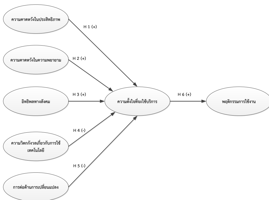
ภาพที่ 1 กรอบแนวคิดในการวิจัย

ซึ่งได้รับการระบุว่าเป็นความกังวลหลักที่มีอิทธิพลต่อความตั้งใจของผู้สูงอายุในการรับบริการสุขภาพผ่านโทรศัพท์เคลื่อนที่ (Mobile Health Services หรือ M-Health Services) ซึ่งมีการรับรู้โดยทั่วไปว่าผู้สูงอายุมีทักษะการใช้งานเทคโนโลยีใหม่ ๆ ในระดับที่ยังไม่มีความเชี่ยวชาญ หรือคุ้นเคย และมีประสิทธิภาพในการใช้เทคโนโลยีน้อยกว่ากลุ่มคนที่มีช่วงอายุน้อยกว่า (Czaja et al., 2006) นอกจากนี้ความสามารถทางกายภาพและความรู้ความเข้าใจที่ลดลงอาจทำให้พวกเขาได้รับความวิตกกังวลในระดับที่สูงขึ้น ซึ่งอาจจะส่งผลให้สามารถลดความตั้งใจในการใช้เทคโนโลยีที่เป็นนวัตกรรมใหม่ๆ ได้ (Chaklader et al., 2003) มาทำการศึกษาร่วมกับทฤษฎีรวมของการยอมรับและการใช้เทคโนโลยี (UTAUT) จากการทบทวนวรรณกรรม สามารถนำมาสร้างกรอบงานวิจัยได้ดังต่อไปนี้