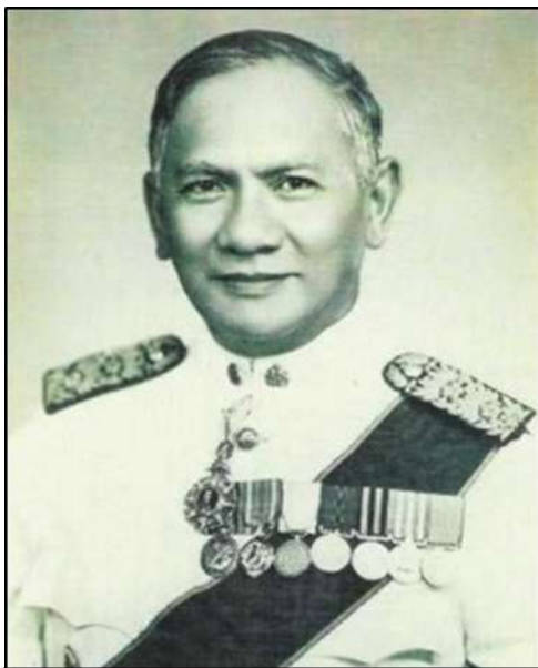
ศาสตราจารย์ หม่อมหลวงปิ่น มาลากุล