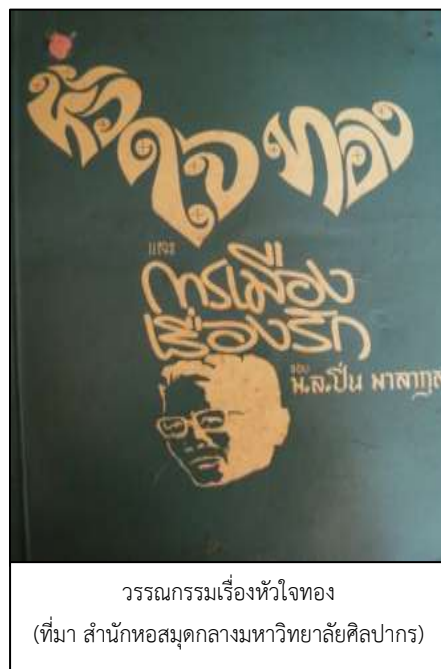
วรรณกรรมเรื่องหัวใจทอง

เหตุใดเรื่อง “หัวใจทอง” จึงได้รับการคัดเลือกให้เป็นวรรณกรรมแห่งชาติ นั้นเพราะวรรณกรรมเรื่องนี้ “สูงส่งด้วยคุณค่าและคุณงามความดีในหลายทาง”