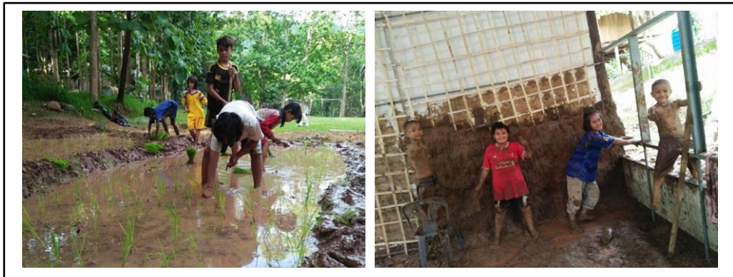
ภาพที่ 3 ตัวอย่างกิจกรรมการเรียนรู้ที่สัมพันธ์กับวิถีชุมชน โดยใช้กระบวนการจัดการเรียนรู้โดยใช้ปัญหาเป็นฐาน (Problem Based Learning : PBL)