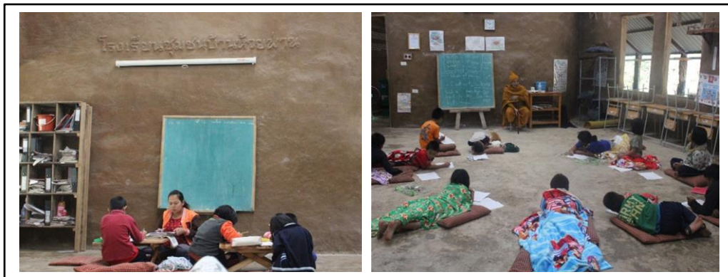
ภาพที่ 2 รูปแบบการจัดกิจกรรมการเรียนการสอนแบบคละชั้นในช่วงเช้า

ชาวบ้าน ในส่วนของการจัดการเรียนการสอนในช่วงเช้านั้นจะเรียนรายวิชาพื้นฐาน คือ คณิตศาสตร์ ภาษาไทย ภาษาอังกฤษ นักเรียนจะร่วมกันเลือกเรียน 1 วิชา เมื่อได้ข้อสรุปแล้วก็จะเรียนแบบคละชั้น คือแบ่งเป็น 2 กลุ่ม คือ กลุ่มที่ 1 ระดับชั้นป.1-ป.3 และ กลุ่มที่ 2 ระดับชั้นป.4-ป.6 โดยมีครูผู้สอนประจำแต่ละกลุ่ม ซึ่งนักเรียนจะเรียนร่วมกันในห้องเรียนรวมแต่แบ่งพื้นที่ออกเป็น 2 ส่วน มีการประเมินความรู้ความเข้าใจโดยการทำแบบฝึกหัด ทำหน่วยเรียนรู้ แต่ไม่มีการประเมินโดยใช้แบบทดสอบเพื่อการจัดลำดับผลการเรียน