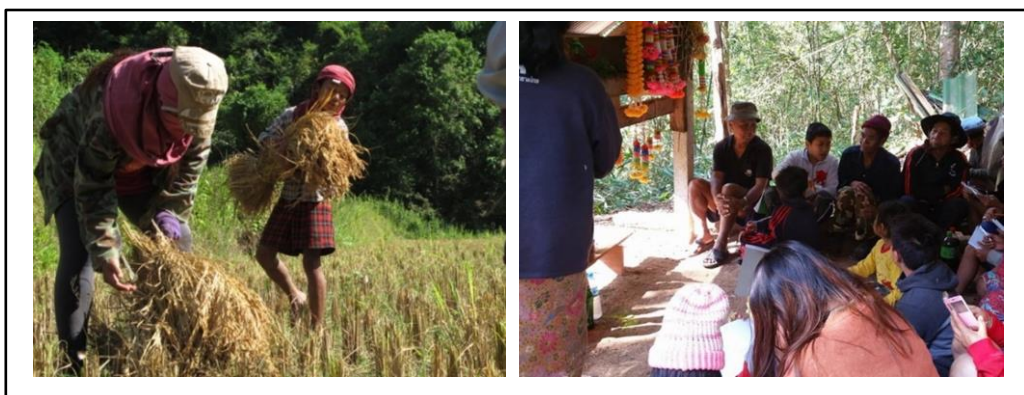
ภาพที่ 5 ตัวอย่างการเรียนรู้ผ่านการปฏิบัติร่วมกับผู้อื่นโดยการเอามื้อเอามาแรงเกี่ยวข้าว และเรียนรู้โดยการเข้าร่วมพิธีลอมจ้าวบ้าน

3.3 การเรียนรู้จากวิถีชุมชน ชุมชนบ้านห้วยพ่านอาศัยอยู่ในพื้นที่ป่าสงวนแห่งชาติ จึงยังคงมีความเชื่อและเคารพศรัทธาธรรมชาติ ทำให้มีพิธีกรรมมากมายที่นักเรียนได้เรียนรู้ถึงสาเหตุและขั้นตอนในการประกอบพิธี เช่น พิธีเลี้ยงผีป่า พิธีบวชปลา พิธีสู่วัณญ์ ตลอดจนการใช้ประโยชน์จากแหล่งอาหารที่มีอยู่ในชุมชน ซึ่งเป็นมาของคำว่า “ความมั่นคงทางอาหาร” นักเรียนจะได้เรียนรู้วิธีการหาอาหารจากพื้นป่า แหล่งน้ำ โดยการสังเกตและทดลองทำตามผู้ใหญ่ ชุมชนยังคงมีวัฒนธรรม “เอามื้อเอามาแรง” ให้รู้จักเสียสละช่วยเหลือผู้อื่น การเรียนรู้ที่สัมพันธ์กับวิถีชุมชนไม่ว่าจะเป็น การดำรงชีวิตที่อาศัยทรัพยากรธรรมชาติ ประเพณี วัฒนธรรม ภาษา ทำให้เกิดการเรียนรู้ที่หลากหลายตอบสนองความสนใจและความสามารถอันหลากหลายของนักเรียนวิถีชุมชนจึงเป็นแหล่งเรียนรู้ที่สำคัญของนักเรียนอีกแห่งหนึ่ง