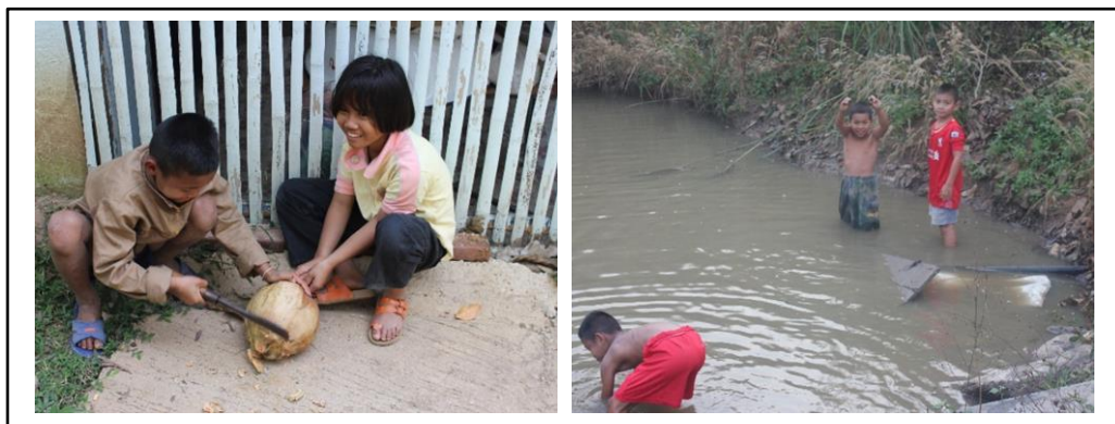
ภาพที่ 4 ตัวอย่างทักษะต่าง ๆ ของนักเรียนที่ผู้ปกครองให้บุตรหลานได้การเรียนรู้ผ่านการปฏิบัติ

3.2 การเรียนรู้จากครอบครัว นักเรียนจะได้รับการอบรมสั่งสอนด้านคุณธรรม ความดี ความเชื่อ ประเพณีและวัฒนธรรมของชุมชนจาก พ่อ แม่ ปู่ ย่า ตา ยาย หรือผู้ใหญ่ในชุมชนที่เปรียบเสมือนคนในครอบครัวเดียวกัน โดยผู้ปกครองจะฝึกให้บุตรหลานได้เรียนรู้ผ่านการปฏิบัติหรือลงมือทำเช่น ทำงานบ้าน หนึ่งข้าว ทำกับข้าว งานในไร่ ทำนา เลี้ยงวัว เลี้ยงควาย ปลูกผัก หาปลา เป็นการฝึกปฏิบัติเพื่อให้บุตรหลานของพวกเขาสามารถทำมาหากินดำรงเลี้ยงชีพพึ่งพาตนเองได้ตามวิถีชุมชนที่ต้องพึ่งพาอาศัยธรรมชาติ