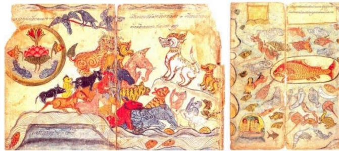
ภาพที่ 8 ราชสีห์เป็นใหญ่ในหมู่มสัตว์สี่ตีนและปลาอนนทเป็นใหญ่ในหมู่มสัตว์น้ำ

จากข้อความข้างต้น ซึ่งเป็นไตรภูมิในเอกสารฉบับกรุงศรีอยุธยาที่กล่าวไว้ว่าการเลือกผู้เป็นใหญ่ในเหล่าสิ่งมีชีวิตนานาชนิดนั้นเป็นไปด้วยการแต่งตั้งจากผู้เป็นใหญ่ในจักรวาล คือ พระบรมสวรถ แต่ในภาพเขียนกลับแสดงด้วยภาพว่า เหล่าสัตว์ต่างเป็นผู้ประชุมเลือกผู้เป็นใหญ่กันเอง ดังเช่น (ภาพที่ 8) ภาพดังกล่าวจึงมีความขัดแย้งต่อไตรภูมิในภาคเอกสาร สันนิษฐานได้ว่าช่างอาจตีความว่า สัตว์เหล่านั้นได้รับบัญชามาให้เลือกผู้ที่จะมาปกครองตนเองก็เป็นได้