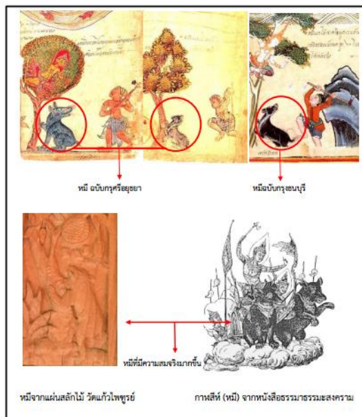
ภาพที่ 7 การเปรียบเทียบภาพหมี่จากสมุดไทยกับหมี่จากแผ่นสลักไม้ วัดแก้วโพธิ์ชัย และหมี่จากหนังสือธรรมาธรรมะสงคราม

แม้ว่าสัตว์หิมพานต์จะเกิดขึ้นจากจินตนาการ จากวรรณกรรมทางศาสนา ตลอดจนการประดิษฐ์คิดสร้างขึ้นอย่างอิสระของช่าง เพื่อมีวัตถุประสงค์ในการใช้งานหรือเพื่อแสดงความสามารถด้านการออกแบบของช่างมาตั้งแต่สมัยกรุงศรีอยุธยา (ตามหลักฐานทางประวัติศาสตร์ศิลปะ) การสืบทอดแนวคิด และรูปแบบบางประการยังคงปรากฏอยู่ในสมัยปัจจุบันด้วย ซึ่งมีความชัดเจนว่าได้รับองค์ความรู้การสร้างสรรค์มาจากสมัยต้นกรุงรัตนโกสินทร์ แม้ว่าจะมีพระวินิจฉัยของสมเด็จพระเจ้าบรมวงศ์เธอ เจ้าฟ้ากรมพระยานริศรานุวัดติวงศ์ในทางที่ว่า ตำราภาพสัตว์หิมพานต์บางชนิดช่างคิดผสมกันเองอย่างเลอะเทอะก็ตาม “...อันสัตว์หิมพานต์นั้น มันหลงเลอะกันมาหลายทอด...” (ตัวสะกดตามต้นฉบับ) (สมเด็จพระเจ้าบรมวงศ์เธอ เจ้าฟ้ากรมพระยานริศรานุวัดติวงศ์, 2552: 186)