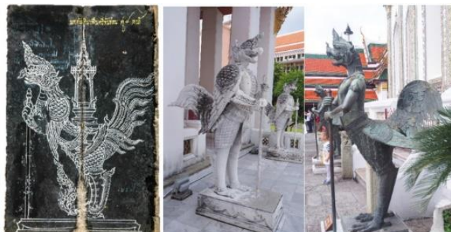
ภาพที่ 4 นกทมิฬที่แสดงลักษณะร่วมสมัยกัน

อิทธิพลด้านรูปแบบของช่างไทย ในการสร้างสรรค์รูปสัตว์หิมพานต์ที่ปรากฏในสมุดภาพไทยคำสมัยรัชกาลที่ 3 ยังคงส่งผลมาถึงปัจจุบัน ดังจะพบว่าเมื่อมีการสร้างรูปสัตว์หิมพานต์ประดับภูมิทัศน์ในการจัดสร้างพระเมรุมาศพระบาทสมเด็จพระเจ้าอยู่หัว รัชกาลที่ 9 จะต้องอาศัยหลักฐานจากเอกสารโบราณต่าง ๆ ตัวอย่างเช่น ช้าง 10 หมูในพรหมพงษ์ มีรูปแบบใกล้เคียงกับภาพร่างในสมุดรัตนโกสินทร์ตอนต้น (ภาพที่ 6) รูปแบบที่เด่นชัดคือ โครงสร้างโดยรวมมีส่วนโค้งของหัว งวงและหน้าขาที่คล้ายกัน มีลักษณะอย่างช่างในจิตรกรรมไทยและเพิ่มเติมรายละเอียดอื่น ๆ ด้วยสีสันทนและท่าทางที่ผ่อนคลายดูมีชีวิตและกลมกลืนกับสภาพแวดล้อมของป่าหิมพานต์ที่อยู่ร่วมกับสัตว์ผสมอื่น ๆ ด้วย