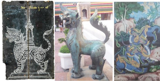
ภาพที่ 5 สิ่งห้อย่างไทยสมัยรัตนโกสินทร์