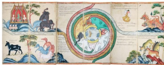
ภาพที่ 1 สมุดภาพไตรภูมิแสดงภาพสระอโนดาต

ทั้งนี้ อาจเป็นเพราะการผสมสัตว์ที่มีลักษณะต่างประเภทกันจะทำให้เกิดความรู้สึกถึงความแปลกประหลาดได้อย่างชัดเจน