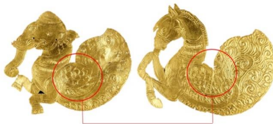
ภาพที่ 2 การแสดงลักษณะเด่นของสัตว์ผสมจากแผ่นทองคำรูปช้างปีกและม้าปีก สมัยอยุธยา