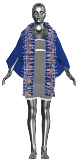
V stitcher program

4. การตัดเย็บเครื่องแต่งกายสตรี ใช้วิธีการทำแบบตัดรูปทรงสี่เหลี่ยมสู่การสวมใส่ได้ 2 รูปแบบนั้น เป็นการทำให้แบบตัดที่ใช้ลักษณะชิ้นส่วนที่เป็นสี่เหลี่ยมจำนวน 3 ชิ้นที่มีขนาดต่างกัน มาเย็บประกอบเพื่อให้เกิดเป็นตัวเสื้อคลุม ที่นำผ้าทุกชนิดมาตัดเย็บเป็นเสื้อคลุมสำหรับสตรี เพื่อใช้ในการสวมใส่ในชีวิตประจำวัน และเป็น การสร้างแนวความคิดการทำแบบตัด และการออกแบบเสื้อ ให้เหมาะสมกับแต่ละกลุ่มผู้บริโภคต่อไปทิศทางของการ แต่งกายที่เปลี่ยนแปลงไปตามยุคสมัย