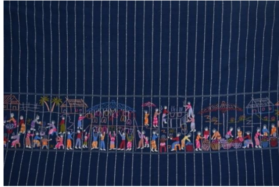
ภาพที่ 5 แสดงการออกแบบลวดลายใช้เทคนิควิธีการปักไหมด้วยมือ (Hand Embroidery)

3. การออกแบบลวดลายใช้เทคนิควิธีการปักไหมด้วยมือ (Hand Embroidery) โดยใช้แรงบันดาลใจจากพื้นฐานทางวัฒนธรรมของสังคมไทย ด้วยการใช้อรรถาธิบายจากถนนคนเดินในพื้นที่จังหวัดเชียงใหม่ ซึ่งเป็นพื้นที่ทางภาคเหนือของประเทศไทย ถ่ายทอดสู่ผืนผ้าจำนวน 1 ชิ้น แสดงออกถึงสุนทรียภาพด้านศิลปะบนผืนผ้าที่สอดคล้องกับรูปแบบการใช้ชีวิตของมนุษย์และสังคมร่วมสมัยในปัจจุบัน