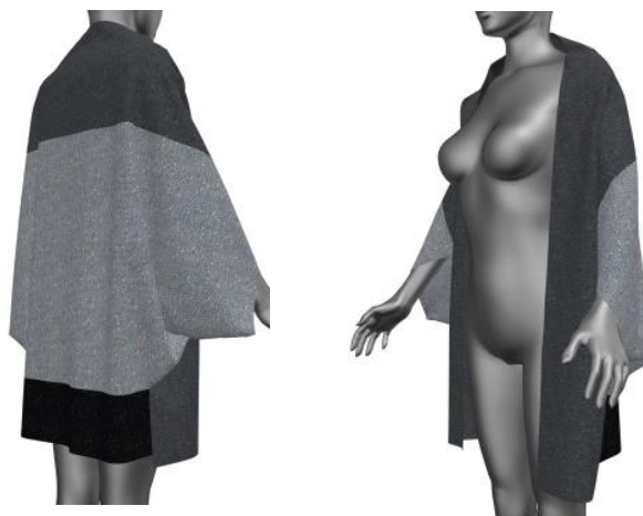
ภาพที่ 4 แสดงรูปการออกแบบด้านหลัง และด้านข้างของตัวเสื้อ