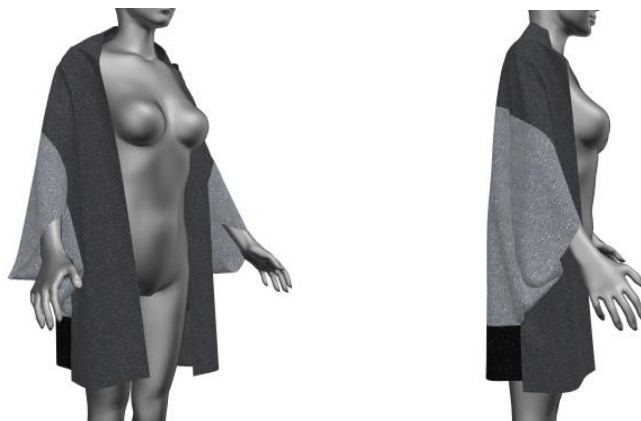
ภาพที่ 3 แสดงรูปการออกแบบด้านหน้า และด้านข้างของตัวเสื้อ

2. การออกแบบสร้างสรรค์โดยการใช้ V stitcher Program (3D) เป็นโปรแกรมที่สามารถใช้ร่วมกับการออกแบบเสื้อคลุมตามที่นักวิจัยได้ออกแบบไว้ สามารถออกแบบเบื้องต้นให้เห็นภาพตัวอย่างเสื้อคลุมหลังการออกแบบก่อนการตัดเย็บผลิตภัณฑ์จริงช่วยด้านการลดระยะเวลาในการวิเคราะห์การออกแบบตัด