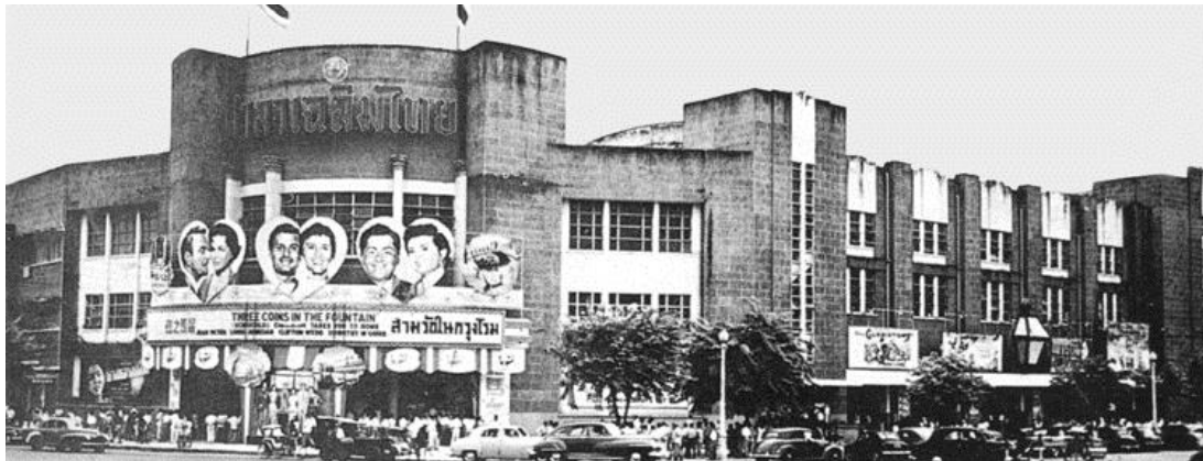
ด้านหน้าอาคารโรงภาพยนตร์ศาลาเฉลิมไทย

“บริเวณเชิงบันไดและผนังมีการออกแบบรูปปูนปั้นเป็นรูปนางละครเพื่อใช้เป็น ลวดลายประดับ ตัวโรงมีที่นั่ง 2 ชั้นตามแบบอย่างโรงละครในยุโรป โดยมีโถงหน้าต่างเข้า โรงที่มีลักษณะเป็นทรงกลมเปิดโล่งจนถึงหลังคารูปโดมที่ให้ความสง่าและหรูหรา การ ออกแบบเสาและซุ้มด้วยลวดลายไทยอย่างวิจิตร มีเวทีขนาดใหญ่ที่ด้านหลังเวทีกว้างขวาง พอสำหรับเปลี่ยนฉากได้อย่างสะดวก” 24