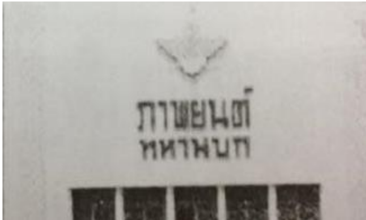
ภาพขยายป้ายหน้าโรงภาพยนตร์ทหารบก