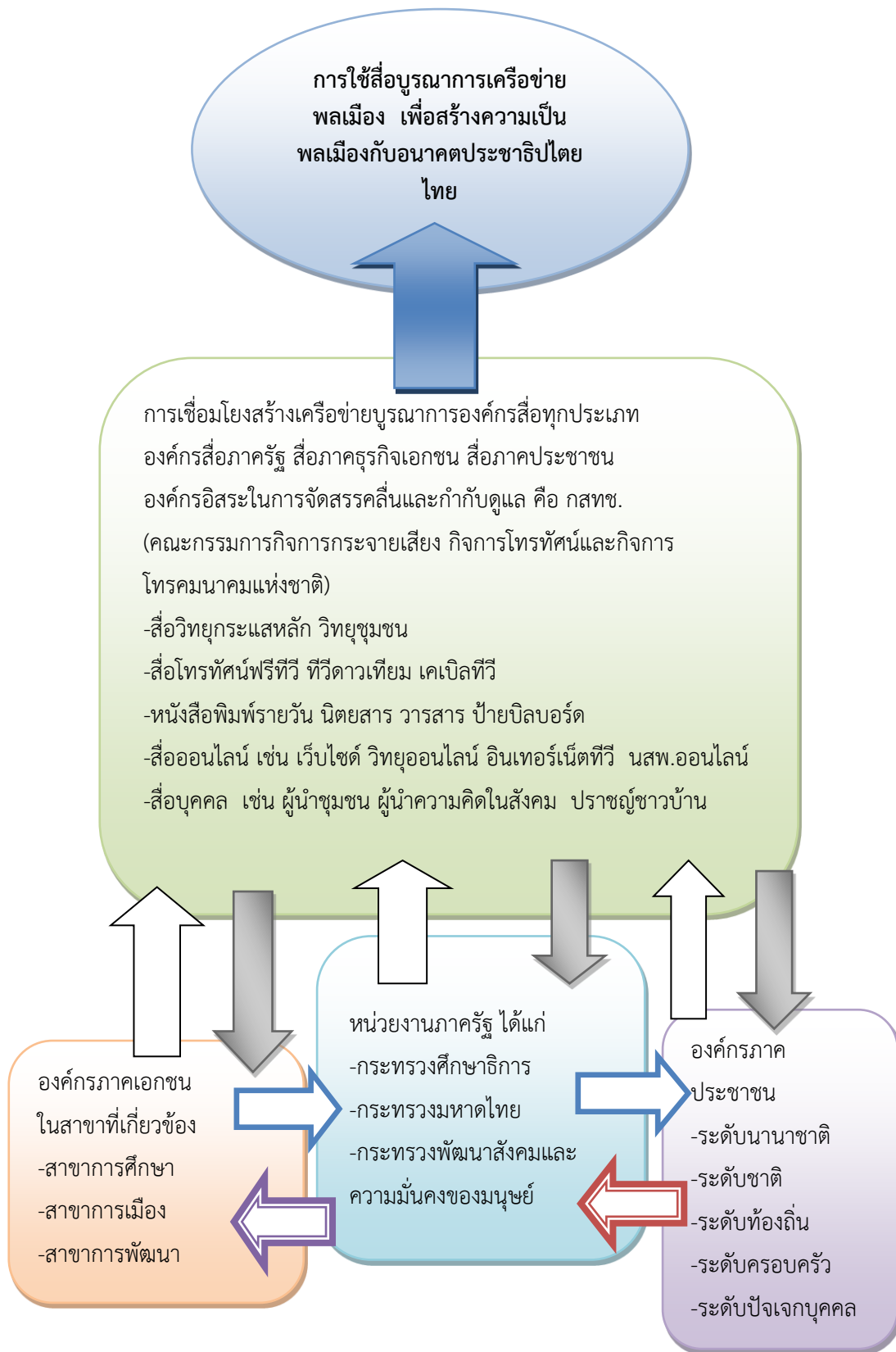
รูปภาพที่ 2 : แนวทางดำเนินงานในเรื่อง “การใช้สื่อบูรณาการเพื่อสร้างความเป็นพลเมืองกับอนาคตประชาธิปไตยไทย” นำเสนอโดย: ญัฐนันท์ ศิริเจริญ (2555)