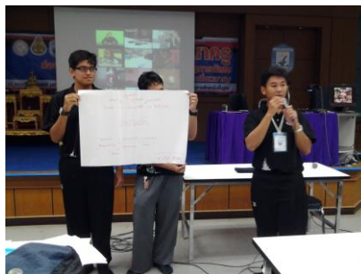
ภาพที่ 2 นิสิตนักศึกษาครูชั้นปีที่ 1 นำเสนอการระดมสมองของกลุ่ม