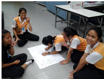
ภาพที่ 1 นิสิตนักศึกษาครูชั้นปีที่ 1 กำลังระดมสมองในการตอบคำถามใน (รูปแบบที่ 1 การฝึกอบรม)