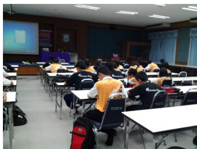
ภาพที่ 3 นิสิตนักศึกษาครูชั้นปีที่ 1 กำลังทำแบบวัดหลังจากการผ่านการฝึกอบรมแล้ว