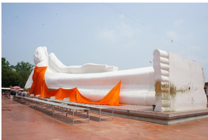
ภาพที่ 7 พระพุทธรูปไสยาสน์ขนาดใหญ่ วัดสระต้อ จังหวัดพระนครศรีอยุธยา