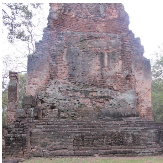
ภาพที่ 2 พุทธปฏิมาไสยาสน์ ในกลุ่มพระสี่อิริยาบถ วัดพระสี่อิริยาบถ จังหวัดกำแพงเพชร