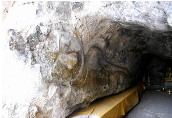
ภาพที่ 1 พุทธปฏิมาไสยาสน์นูนต่ำสลักที่ถ้ำผาโถ บริเวณเขาขง จังหวัดราชบุรี

พุทธปฏิมาไสยาสน์ขนาดใหญ่ปรากฏหลักฐานในดินแดนไทยมาแต่ครั้งวัฒนธรรมศาสนาสมัยทวารวดี แต่คงยังไม่ปรากฏการสร้างที่ใหญ่โตอย่างแท้จริง แต่อย่างน้อยในหลักฐานทางศิลปกรรมพุทธปฏิมาไสยาสน์ขนาดค่อนข้างใหญ่ในสมัยทวารวดี พบบริบทประกอบอย่างชัดเจนว่าเป็นปางปรินิพพาน ตัวอย่างเช่น พุทธปฏิมาไสยาสน์นูนต่ำสลักที่ถ้ำผาโถ (ภาพที่ 1) บริเวณเขาขง จังหวัดราชบุรี ที่มีต้นรังประดับไว้เหนือประภามณฑลตาม คัมภีร์มหาปรินิพพานสูตร (สมเด็จพระปฐมบรมมหาชนกชิโนรส ไม่ปรากฏปีที่พิมพ์: 444-445) สืบต่อมาสมัยอาณาจักรสุโขทัยไม่พบหลักฐานการสร้างพุทธปฏิมาไสยาสน์ขนาดใหญ่ที่ชัดเจน คงพบเพียงพุทธปฏิมาไสยาสน์ที่ปรากฏอยู่ในกลุ่มพระสี่อิริยาบถ (ภาพที่ 2) ที่เป็นพุทธปฏิมาขนาดใหญ่คืออิริยาบถ นั่ง นอน ยืน เดิน หันพระปฤษฎางค์ชนกันทั้งสี่ด้านมีลักษณะแกนรับน้ำหนักก่ออิฐถือปูนที่เป็นอาคารรูปแบบหนึ่ง