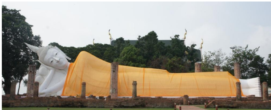
ภาพที่ 4 พระพุทธไสยาสน์ วัดขุนอินทประมูล จังหวัดอ่างทอง