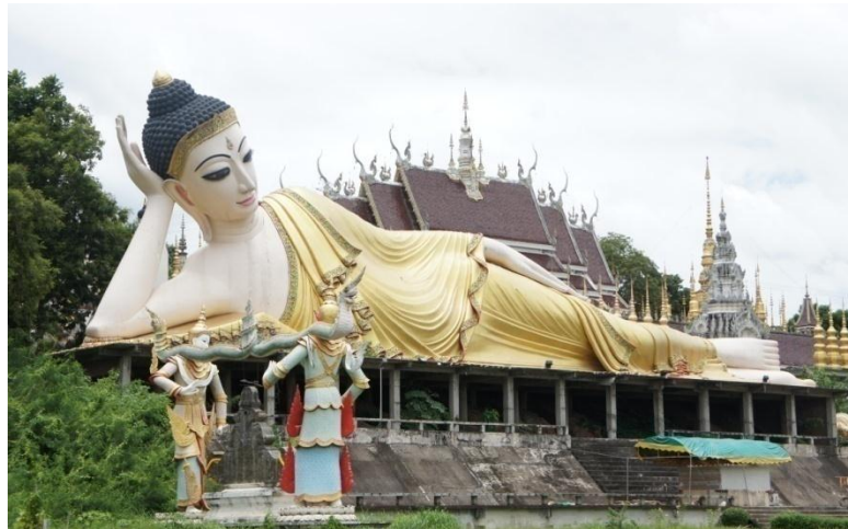
ภาพที่ 8 พุทธปฏิมาไสยาสน์ขนาดใหญ่ วัดพระธาตุสุโทนมงคลคีรี จังหวัดแพร่