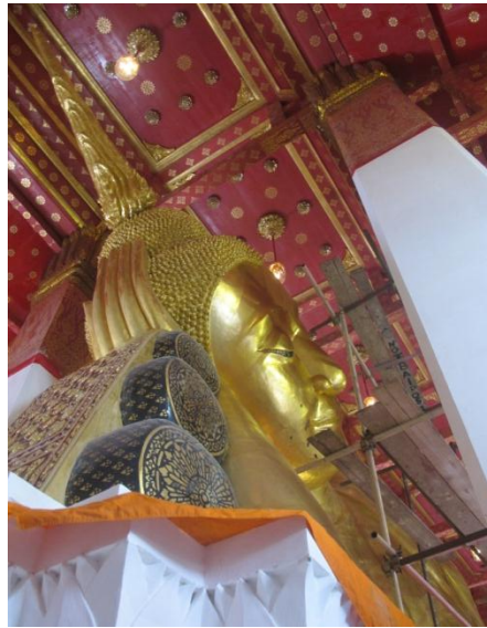
ภาพที่ 5 พระพุทธไสยาสน์วัดป่าโมก จังหวัดอ่างทอง