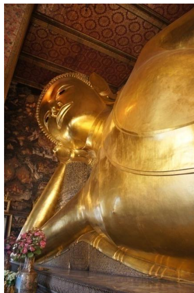
ภาพที่ 6 พระพุทธไสยาสน์ วัดพระเชตุพนวิมลมังคลารามกรุงเทพฯ

แนวความคิดเรื่องขนาดพุทธปฏิมาไสยาสน์ขนาดใหญ่ของสมเด็จพระพุฒาจารย์ (โต พรหมรังสี) สมัยรัตนโกสินทร์ช่วงรัชสมัยพระบาทสมเด็จพระจอมเกล้าอยู่หัวรัชกาลที่ 4 ถึงช่วงรัชสมัยแผ่นดิน พระบาทสมเด็จพระจุลจอมเกล้าเจ้าอยู่หัวรัชกาลที่ 5 ได้ปรากฏการสร้างพุทธปฏิมาขนาดใหญ่หลายองค์ ที่สร้าง