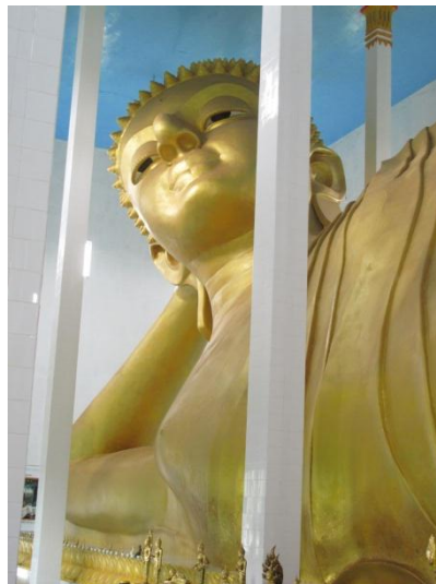
ภาพที่ 9 พุทธปฏิมาไสยาสน์ขนาดใหญ่ วัดสะพานเหล็ก จังหวัดจันทบุรี

ปางโปรดอสูรินทราหูไม่ปรากฏอยู่ในตำราพระพุทธรูปปางต่างๆตามมติ สมเด็จพระมหาสมณเจ้า กรมพระปรมานุชิตชิโนรส (เสาวณิต วิจารณ์, 2550) แต่อย่างไรก็ดี ด้วยตำราดังกล่าวได้มีการรวบรวมปางพระพุทธรูปตามมติของสมเด็จพระมหาสมณเจ้า กรมพระปรมานุชิตชิโนรส ที่ทรงคัดเลือกพุทธอิริยาบถต่างๆ จากเรื่องราวในพุทธประวัติรวมทั้งสิ้น 40 ปางซึ่งถือเป็นต้นแบบของปางพระพุทธรูปในสมัยรัตนโกสินทร์ (สมเด็จพระเจ้าบรมวงศ์เธอกรมพระยาดำรงราชานุภาพ, 2518: 181) ตลอดจนตำราปางพระพุทธรูปฉบับอื่นๆก็ไม่ปรากฏด้วยเช่นกัน