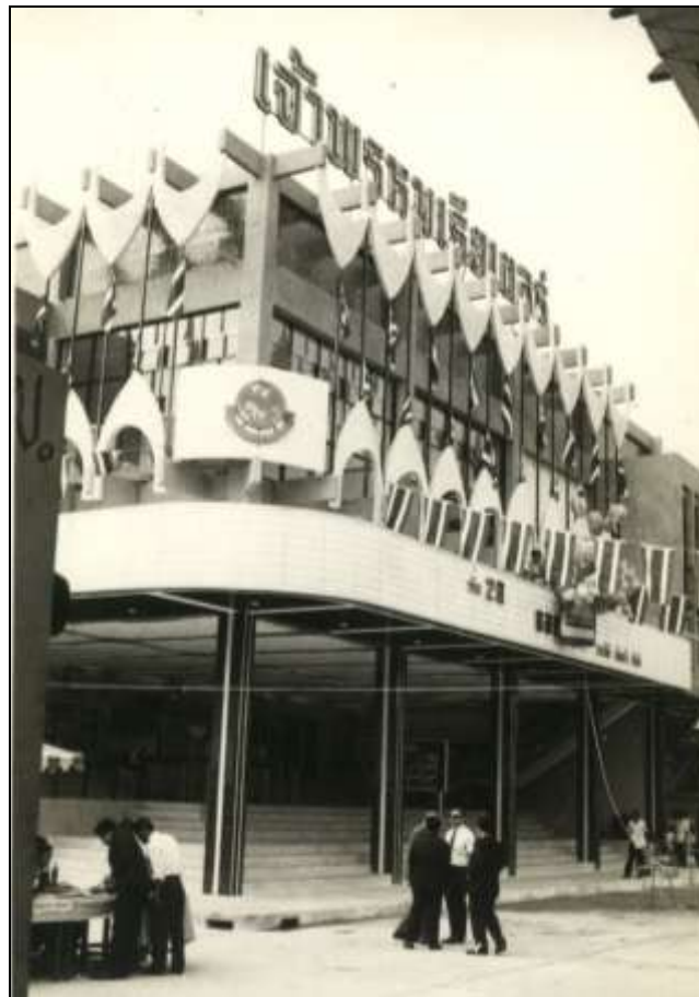
ภาพที่ 3 : โรงภาพยนตร์เจ้าพระมเจียเตอร์ ตลาดหортันไชย เปิดให้บริการในพ.ศ.2515