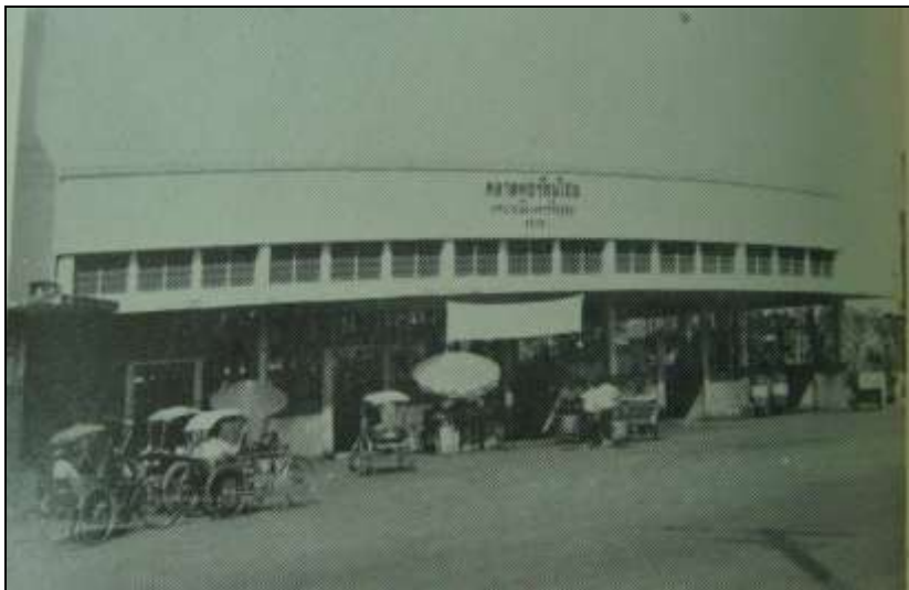
ภาพที่ 2 : ตลาดสดหортันไชย สร้างขึ้นใน พ.ศ. 2500

นอกจากการขยายตัวของย่านอาคารพาณิชย์ริมอุทงหลัง พ.ศ. 2500 ดังกล่าวข้างต้นแล้ว ยังได้มีการสร้างตลาดแห่งใหม่ขึ้นบริเวณริมถนนอุทงในตำบลหортันไชยอีกแห่งหนึ่ง โดยเทศบาลเมืองนครศรีอยุธยาได้ก่อสร้างตลาดสดเป็นตึกคอนกรีตของเทศบาล 1 หลัง กว้าง 30 เมตร ยาว 54 เมตร และถมดินบริเวณที่ก่อสร้างกว้าง 40 เมตร ยาว 80 เมตร สูงจากพื้นดินเดิมเสมอระดับถนนอุทง รวมค่าใช้จ่ายทั้งหมดเป็นเงิน 383,000 บาท 10 ตลาดสดที่สร้างขึ้นใหม่ในพ.ศ. 2500 เรียกว่าตลาดหортันไชยตามตำบลที่ตั้ง และยังคงอยู่ใกล้กับสะพานปรีดี-ธำรงมากกว่าตลาดห้วรอ จึงเป็นทำเลที่เหมาะสมในการก่อสร้างตลาด โดยในระยะแรกผู้ค้าส่วนมากเป็นพ่อค้าแม่ค้าจากตลาดห้วรอที่ทางเทศบาลสนับสนุนให้มาขายของที่ตลาดแห่งใหม่ อย่างไรก็ตามในระยะเวลา 10 ปีแรกที่ก่อตั้ง ตลาดหортันไชยยังเป็นตลาดขนาดเล็กเมื่อเทียบกับห้วรอที่เป็นตลาดประจำจังหวัด สินค้าส่วนใหญ่ที่ขายในตลาดหортันไชย ส่วนมากเป็นสินค้าที่รับมาจากตลาดห้วรอ ตลาดหортันไชยจึงเสมือนเป็นตลาดย่อยของตลาดห้วรอ จำนวนร้านค้าก็ยังมีไม่มากนัก 11 แต่ทางเทศบาลก็ยังคงมีความพยายามส่งเสริมการค้าของตลาดหортันไชยด้วยการสร้างอาคารพาณิชย์ของทางเทศบาลเพิ่มเติมบริเวณใกล้กับตลาดสดเทศบาล