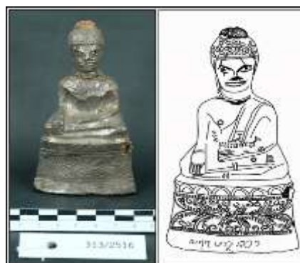
ภาพที่ 5 (ด้านซ้าย) พระพุทธรูป แบบ (5) จากเจดีย์ศรีปมัญญา จังหวัดอุดรธานี (หมายเลขทะเบียน พช.ขก.313/2516)

2. แบบที่ 2 ฐานกลีบบัวผสม (5) เป็นการผสมระหว่างลายกลีบบัวหงายแบบกลีบตั้งตรงกับ ลวดลายไปไม้ม้วน คั่นด้วยเส้นตรงลายกดประทับ ได้ฐานไปไม้ม้วนมีเส้นตรงลายกดประทับรองรับ 1 แถว ฐานรูปสี่เหลี่ยมคางหมู เตี้ย มี 3 ชั้น พบที่เจดีย์ศรีปมัญญา จังหวัดอุดรธานี หมายเลขทะเบียน พช.ขก.313/2516