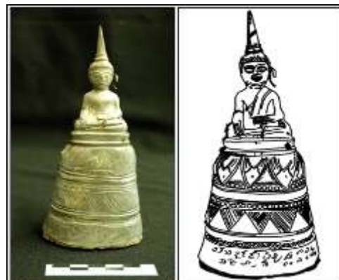
ภาพที่ 13 (ด้านขวา) พระพุทธรูป แบบ (8) จากบ่อพันขัน จังหวัดร้อยเอ็ด (หมายเลขทะเบียน 34/150/254)

2.1 แบบที่ 1 ฐานลายบัวคว่ำเพียงอย่างเดียว (8) คือ เป็นฐานหน้ากระดาน ลายบัวคว่ำ ซ้อนกลีบบัวขนาดเล็กภายในกลีบบัวขนาดใหญ่ รองรับด้วยเส้นเม็ดกระดุม 1 แถว คั่นด้วยลูกแก้วอกไก่ ได้ลายบัวคว่ำมีชั้นสามเหลี่ยมคว่ำตกแต่งเส้นตรงต่อเนื่องรอบฐาน 1 แถว รองรับด้วยเส้นเม็ดกระดุม 1 แถว ฐานสูงปรกวยหัวตัด มี 4 ชั้น พบที่บ่อพันขัน จังหวัดร้อยเอ็ด หมายเลขทะเบียน 34/150/2548