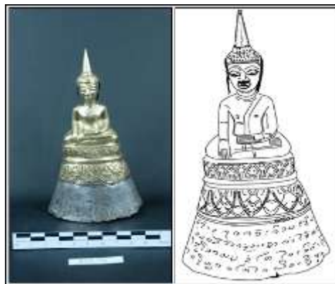
ภาพที่ 11 (ด้านขวา) พระพุทธรูป แบบ (7.3) จากเจดีย์ ศรีปมัญญา จังหวัดอุดรธานี (หมายเลขทะเบียน พช.ขก.323/2516)

1.5 แบบที่ 5 (7.3) ฐานลายบัวคว่ำ – บัวหงายกลีบตั้งตรงโดยกลีบบัวคว่ำ – บัวหงายซ้อนกัน กลีบบัวเรียวยาว ภายในกลีบบัวตกแต่งด้วยเส้นคดโค้งและลายจุด ฐานสูงรูปกรวยหัวตัด มี 3 ชั้น พบที่เจดีย์ศรีปมัญญา จังหวัดอุดรธานี หมายเลขทะเบียน พช.ขก.323/2516