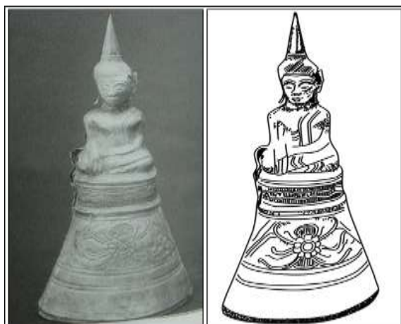
ภาพที่ 20 พระพุทธรูป แบบ (14) จากสถานปฏิบัติธรรมถ้ำสาริกาจังหวัดเลย(หมายเลข 4) ที่มา:กัลยาณี กิจโชติประเสริฐ, “พระพุทธรูปบุเงินจากถ้ำสาริกา” ศิลปากร 5,5 (กันยายน-ตุลาคม 2552): 100.