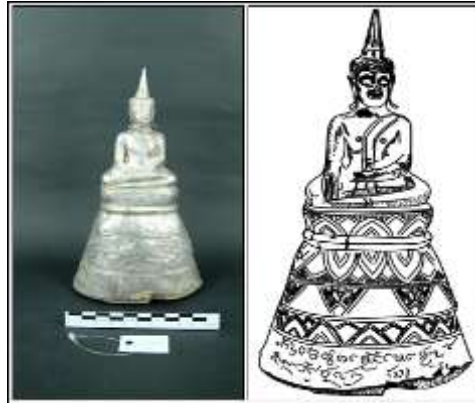
ภาพที่ 10 (ด้านซ้าย) พระพุทธรูป แบบ (7.2.1) จากบ้านนาบอน จังหวัดหนองคาย (หมายเลขทะเบียน1/2556)

1.4 แบบที่ 4 (7.2.1) ฐานลายกลีบบัวคว่ำ – บัวหงายกลีบตั้งตรงโดยกลีบบัวคว่ำ – บัวหงายเป็นกลีบซ้อน คาดด้วยลูกแก้วอกไก่ ระหว่างช่องกลีบบัวตกแต่งด้วยลวดลายเรขาคณิต ใต้ฐานบัวคว่ำมีช่องสามเหลี่ยมตกแต่งลายไปไม้ม้วนเรียงต่อกัน 1 แถว รองรับด้วยชั้นกลีบบัวหงาย 1 แถว ฐานกลมทรงสูง มี 5 ชั้น พบที่บ้านนาบอน จังหวัดหนองคาย หมายเลขทะเบียน 1/2556