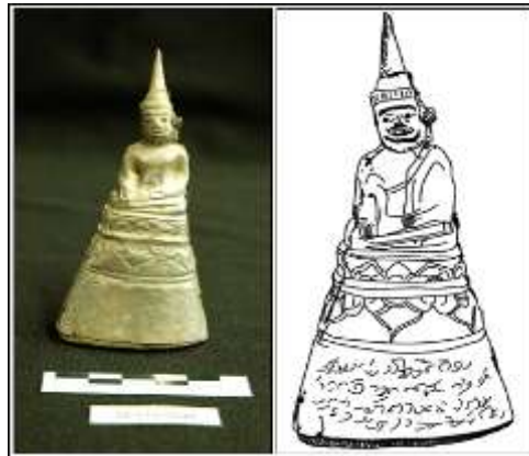
ภาพที่ 12 (ด้านซ้าย) พระพุทธรูป แบบ (7.4) จากบ่อพันขันจังหวัดร้อยเอ็ด (หมายเลขทะเบียน 34/179/2548)