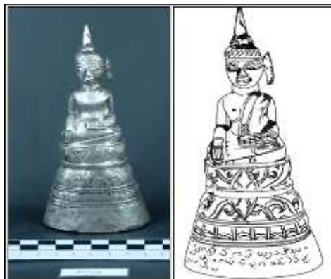
ภาพที่ 15 (ด้านขวา) พระพุทธรูป แบบ (10) จากกุ๋บ้านดอนตู จังหวัดมหาสารคาม (หมายเลขทะเบียน พช.ขก. 51/2534)

3.1 แบบที่ 1 (10) ฐานลายกลีบบัวถลาโดยมีลายบัวคว่ำ – บัวหงายกลีบตั้งตรงอยู่ตรงกลาง ด้านข้างเป็นกลีบบัวถลาที่ตกแต่งด้วยลายใบไม้ม้วน คั่นด้วยลูกแก้วอกไก่ ใต้ลายบัวคว่ำมีช่องสี่เหลี่ยมภายใน ตกแต่งด้วยเส้นโค้ง 1 แถว ฐานทสูงรูปกรวยหัวตัด มี 4 ชั้น พบที่กุ๋บ้านดอนตู จังหวัดมหาสารคาม หมายเลขทะเบียน พช.ขก.51/2534