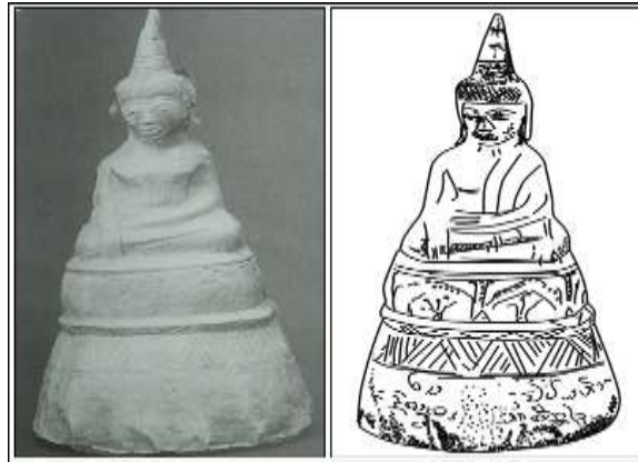
ภาพที่ 18 พระพุทธรูป แบบ (13) จากสถานปฏิบัติธรรมถ้ำสาริกา จังหวัดเลย(หมายเลข 5) ที่มา: กัลยาณี กิจโชติประเสริฐ, “พระพุทธรูปเงินจากถ้ำสาริกา” ศิลปากร 5,5 (กันยายน-ตุลาคม 2552): 101.

4.3 แบบที่ 3 (13.1) ฐานลายประดิษฐ์ โดยส่วนบนเป็นรูปสัตว์ ส่วนล่างเป็นลายสามเหลี่ยม ตกแต่งเส้นตรงสลับต่อเนื่องรอบฐาน คั่นด้วยลูกแก้วอกไก่ ได้ลายสามเหลี่ยมเป็นลายไปไม้้วน 1 แถว ฐานสูงรูป กรวยหัวตัด มี 4 ชั้น พบที่สถานปฏิบัติธรรมถ้ำสาริกา จังหวัดเลย หมายเลข 6