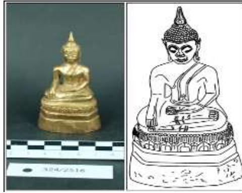
ภาพที่ 14 (ด้านซ้าย) พระพุทธรูป แบบ (9) จากเจดีย์ศรีปมัญญา จังหวัดอุดรธานี (หมายเลขทะเบียน พช.ขก. 324/2516)