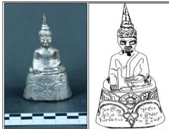
ภาพที่ 17 พระพุทธรูป แบบ (12) จากหมู่บ้านดอนตู จังหวัดมหาสารคาม (หมายเลขทะเบียน พช.ชก95/2550)

4.1 แบบที่ 1 (12) ฐานลายบัวผสม โดยฐานลายบัวหมายถึงกليبบัวซ้อน ด้านล่างประดับลวดลายคล้ายกับ “รวงผึ้ง” ที่ปรากฏบริเวณหน้าสิมหรืออุโบสถในภาคตะวันออกเฉียงเหนือของไทยและประเทศลาว ช่องว่างระหว่างรวงผึ้งจารึกอักษรธรรม ฐานเดี่ยวรูปกรวยหัวตัด มี 2 ชั้น พบที่หมู่บ้านดอนตู จังหวัดมหาสารคาม หมายเลขทะเบียน พช.ชก.95/2550