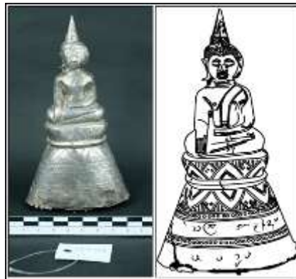
ภาพที่ 8 พระพุทธรูป แบบ (7.1) จากบ้านนาบอน จังหวัดหนองคาย (หมายเลขทะเบียน 25/2556)

1.2 แบบที่ 2 (7.1) ฐานลายกลีบบัวคว่ำ – บัวหงายกลีบตั้งตรงโดยกลีบบัวคว่ำ – บัวหงายซ้อนกัน ขอบกลีบบัวด้านนอกตกแต่งด้วยลายขีด หรือเส้นวงกลม ฐานใต้ชั้นบัวคว่ำจารึกอักษรธรรมอีสานหรืออักษรไทยน้อย มีเส้นลวดบัว หรือเส้นเม็ดกระดุมคั่นตรงกลาง ช่องว่างระหว่างกลีบบัวขีดเส้นตรงในแนวตั้งเต็มช่อง ฐานสูงรูปกรวยหัวตัด มี 4 ชั้น พบที่บ้านนาบอน จังหวัดหนองคาย จำนวน 2 องค์ หมายเลขทะเบียนน 23/2556 และ 25/2556