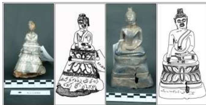
ภาพที่ 4 (จากซ้ายไปขวา) พระพุทธรูป แบบ (4) จากหมู่บ้าน ดอนตู จังหวัดมหาสารคาม (พช.ขก.53/2550) และ พระพุทธรูป แบบ (4.1) จากเจดีย์ศรีปมัญญา จังหวัดอุดรธานี (พช.ขก.316/2516) ตามลำดับ

นอกจากนี้ยังพบลวดลายแบบใหม่ที่ไม่ปรากฏในช่วงพุทธศตวรรษที่ 21 คือ ลวดลายกลีบบัวที่ปลายกลีบโค้งออกด้านนอกเล็กน้อย คั่นด้วยเส้นเม็ดกระดุม เป็นฐานเหลี่ยมเตี้ย มี 3 ชั้น (4.1) พบที่เจดีย์ศรีปมัญญา จังหวัดอุดรธานี หมายเลขทะเบียน พช.ขก.316/2516