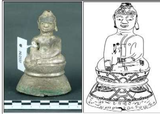
ภาพที่ 16 (ด้านซ้าย) พระพุทธรูป แบบ (11) จากหมู่บ้านดอนตู จังหวัดมหาสารคาม (หมายเลขทะเบียน พช.ชก. 94/2550)