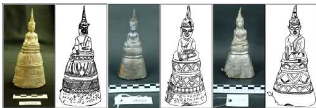
ภาพที่ 9 (จากซ้ายไปขวา) พระพุทธรูป แบบ (7.2) จากบ่อพันขัน จังหวัดร้อยเอ็ด (34/152/2548)

1.3 แบบที่ 3 (7.2) ฐานลายบัวคว่ำ – บัวหงายกลีบตั้งตรง โดยกลีบบัวคว่ำ – บัวหงายซ้อนกัน คั่นด้วยลูกแก้วอกไก่ ได้ฐานบัวคว่ำเพิ่มขึ้นฐาน 1 ชั้น พบทั้งลายเรขาคณิต และลายกลีบบัว ฐานชั้นล่างสุดเป็นฐานเรียบ จารึกอักษรธรรมและอักษรไทยน้อย เป็นฐานรูปกรวยหัวตัด 5 ชั้น พบที่บ่อพันขัน จังหวัดร้อยเอ็ด หมายเลขทะเบียน 34/152/2548 ภูตะกา จังหวัดขอนแก่น หมายเลขทะเบียน พช.ขก.24/2519 และบ้านนาบอน จังหวัดหนองคาย หมายเลขทะเบียน 51/2556