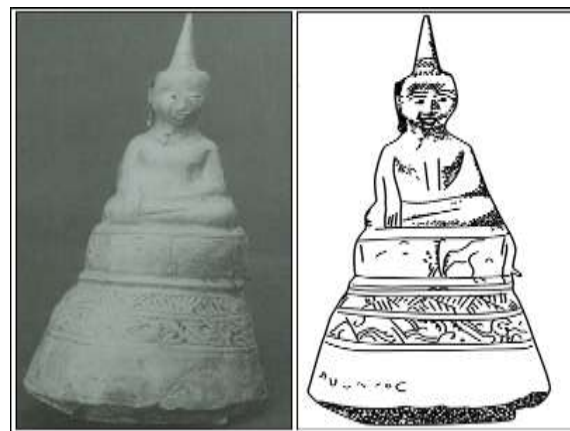
ภาพที่ 19 พระพุทธรูป แบบ (13.1) จากสถานปฏิบัติธรรมถ้ำสาริกา จังหวัดเลย (หมายเลข 6)

4.3 แบบที่ 3 (13.1) ฐานลายประดิษฐ์ โดยส่วนบนเป็นรูปสัตว์ ส่วนล่างเป็นลายสามเหลี่ยม ตกแต่งเส้นตรงสลับต่อเนื่องรอบฐาน คั่นด้วยลูกแก้วอกไก่ ได้ลายสามเหลี่ยมเป็นลายไปไม้้วน 1 แถว ฐานสูงรูป กรวยหัวตัด มี 4 ชั้น พบที่สถานปฏิบัติธรรมถ้ำสาริกา จังหวัดเลย หมายเลข 6