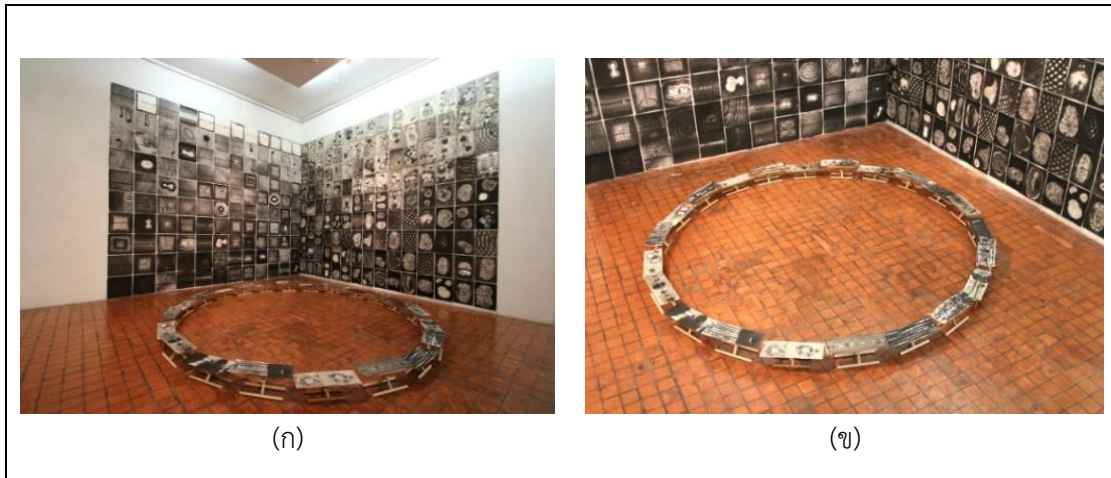
ภาพที่ 5 ภาพตัวอย่างผลงานติดตั้งบนผนังในห้องจัดแสดงภายในหอศิลป์สมเด็จพระนางเจ้าสิริกิติ์ พระบรมราชินีนาถ ชื่อภาพ การเดินทางเข้าสู่วิหารแห่งจิต เทคนิค หมึกดำ, ถ่าน, ทองคำเปลวบนกระดาษ ขนาด ขนาดปรับเปลี่ยนตามความเหมาะสมของพื้นที่ ปี พ.ศ. 2558 (ก) ภาพผลงานมุมมองที่ 1 (ข) ภาพผลงานมุมมองที่ 2

ด้านกายภาพ การนำเสนอผลงานจะใช้ความประสานกลมกลืนด้วยวิธีการที่ไม่มีการกำหนดระดับตาและมุมมองที่แน่นอนระหว่างผนังและพื้นซึ่งเชื่อมต่อกันด้วยจำนวนผลงาน 300 ชิ้น ในพื้นที่ของห้องแสดงผลงานหอศิลป์พิพิธภัณฑ์สถานแห่งชาติหอศิลป์เจ้าฟ้า (ภาพที่ 5) การคลี่คลายรูปทรงจากฝักบัวและริ้วของคลื่นผ่านอารมณ์ความรู้สึก การสัมผัสถึงลมหายใจเข้าออกเสมือนการสวดมนต์ภาวนาหรือการนับลูกประคำ ส่งผลให้ผลงานปรากฏรูปแบบนามธรรมด้วยการเชื่อมประสานซึ่งความรู้สึกเคลื่อนไหว กระบวนการจัดวางผลงานไปพร้อมกับการสังเคราะห์โดยการคัดเลือกเรียงลำดับเพื่อให้ผู้ดูเกิดการไตร่ตรอง (Meditate) ผ่านผัสสะทางกายภาพจากประสบการณ์ที่ซับซ้อนจังหวะของธรรมชาติ ผ่านสัมผัสการรับรู้และการเชื่อมประสานซึ่งอารมณ์ความรู้สึก ด้วยภาพในแต่ละชั้นเรียงต่อกันประหนึ่งการทำสมาธิแบบเคลื่อนไหวโดยการจัดวางบนผนังและพื้นภายในห้องจัดแสดง