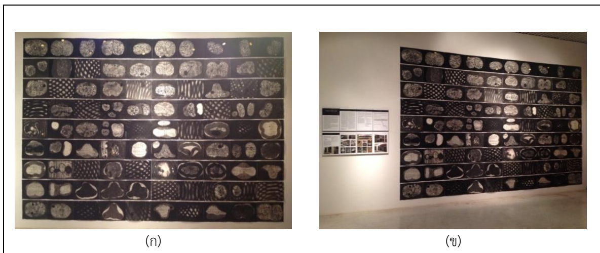
ภาพที่ 3 ภาพตัวอย่างผลงานติดตั้งบนผนังในห้องจัดแสดงภายในหอศิลป์ คณะจิตรกรรมประติมากรรม และภาพพิมพ์ มหาวิทยาลัยศิลปากร