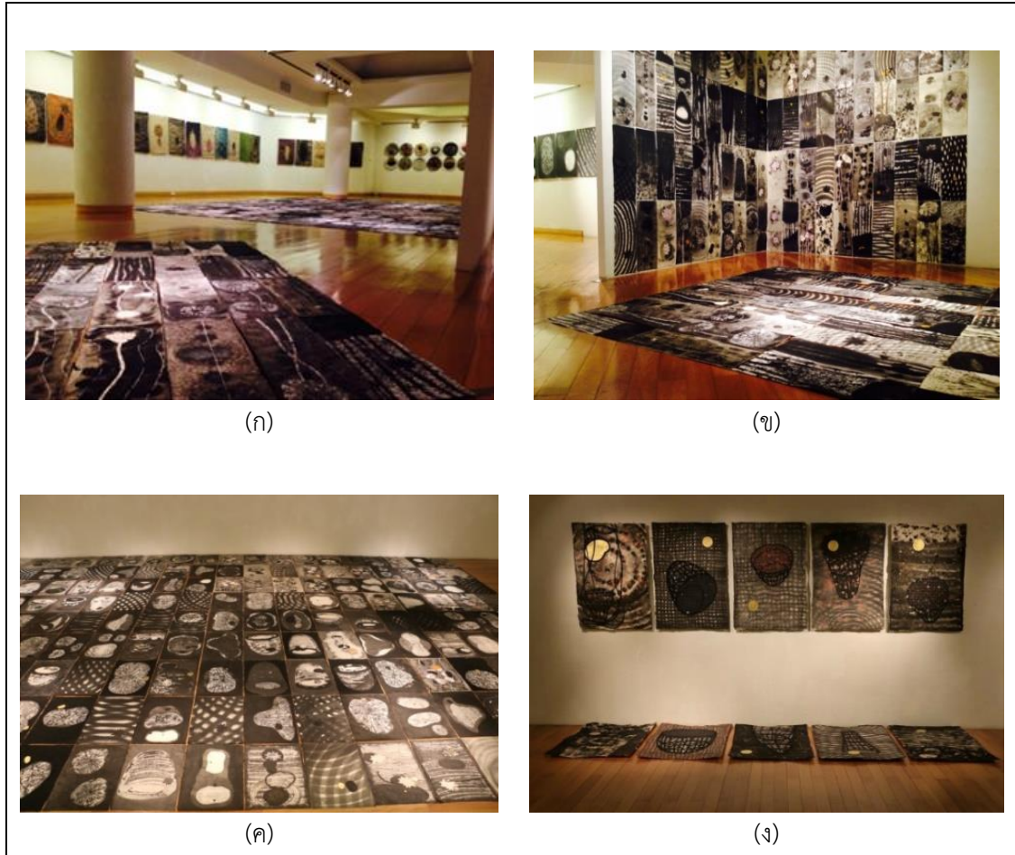
ภาพที่ 4 ภาพตัวอย่างผลงานติดตั้งบนผนังในห้องจัดแสดงภายในหอศิลป์สมเด็จพระนางเจ้าสิริกิติ์ พระบรมราชินีนาถ