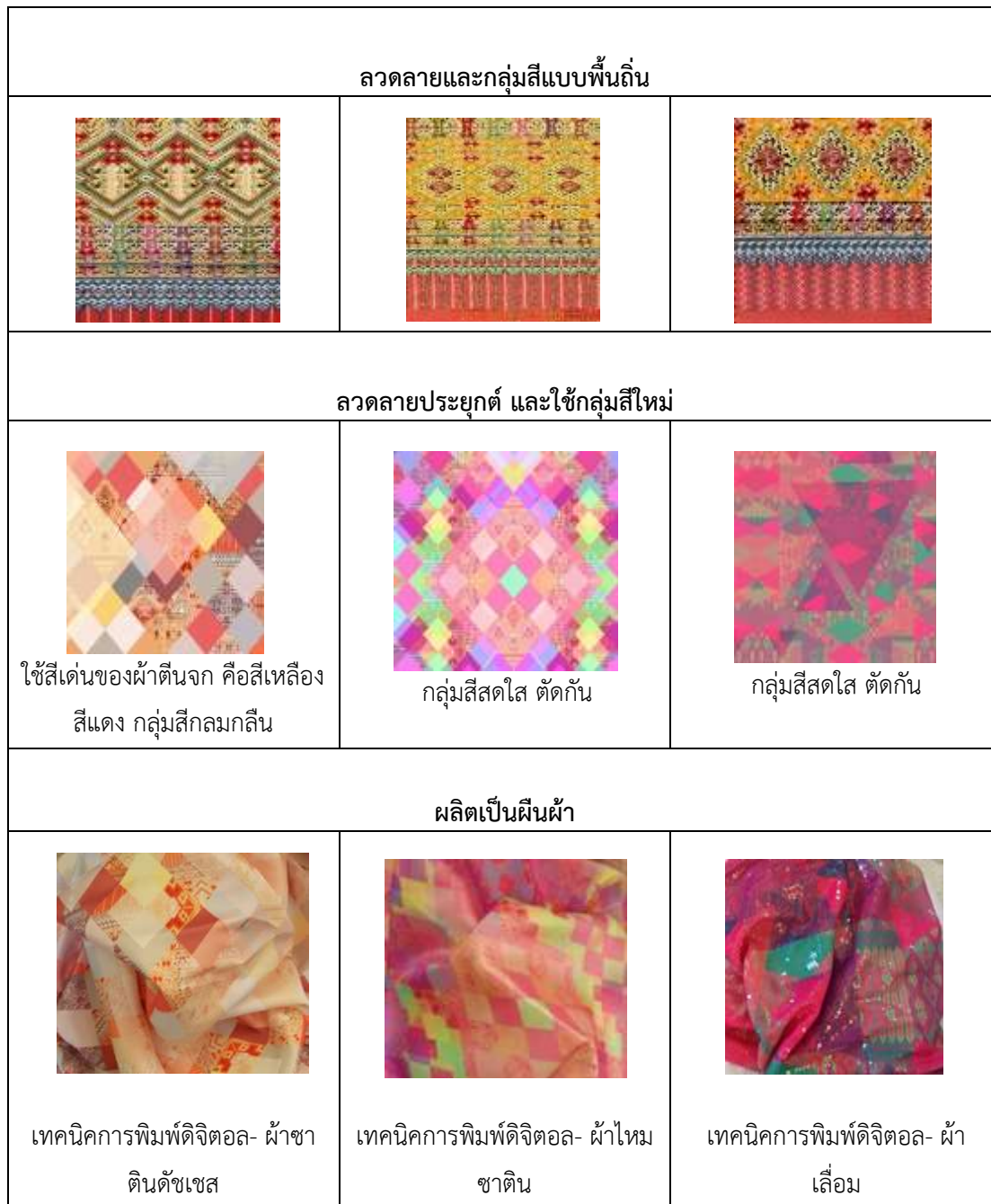
ตารางที่ 2 ตัวอย่างการคัดเลือกลวดลายและการผลิตเป็นผืนผ้า