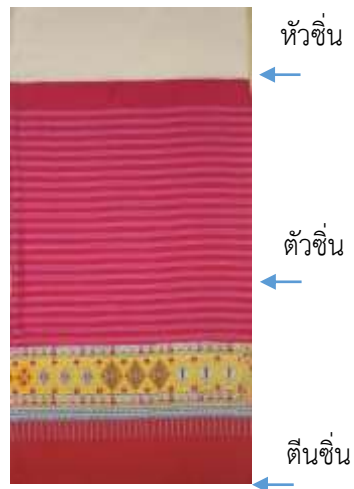
ภาพที่ 2 ผ้าซิ่นตีนจกแม่แจ่ม

- ด้านลวดลายและการใช้สี ลายที่เป็นลักษณะเด่นมี 2 แบบ คือ