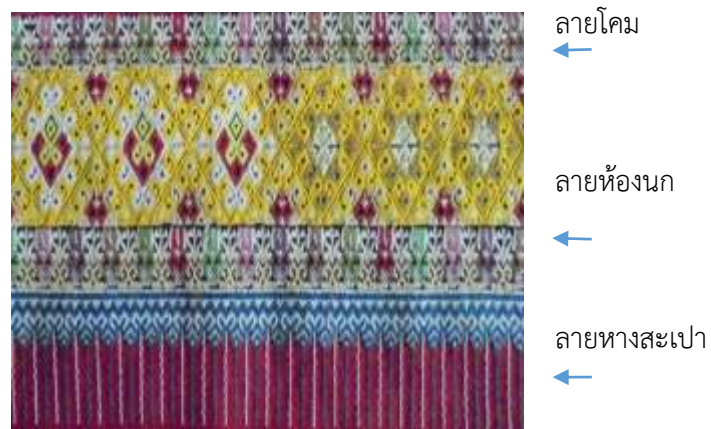
ภาพที่ 3 ลวดลายผ้าทอตีนจกแบบลายโคม

1. ลวดลายตีนจกแบบลายโคม เป็นลายหลักที่มีในผ้าทอตีนจกแม่แจ่มเป็นส่วนใหญ่ ลายโคมมีลักษณะเป็นสี่เหลี่ยมขนมเปียกปูน อยู่ตรงกลางของผ้าโดยทอติดต่อกันเต็มความกว้างของผ้า ลวดลายที่อยู่ในลายโคมที่นิยม ประกอบด้วยลายนกหรือลายหงส์แบบต่างๆ และลายซัน มีลายประกอบอยู่ด้านบนและล่างของลายโคม คือ ลายห้องนก ที่ประกอบด้วยลายขอไล่และลายน้ำตัน ส่วนล่างสุดของผ้าคือลาย หางสะเปา