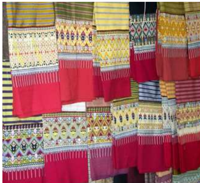
ภาพที่ 1 ลวดลายผ้าซิ่นตีนจกแม่แจ่ม

- ด้านอัตลักษณ์ของผ้าซิ่นตีนจกแม่แจ่ม คือ ลักษณะของตัวซิ่น ที่ประกอบด้วยผ้า 3 ส่วน คือหัวซิ่น ตัวซิ่น และตีนซิ่น ที่ทอเป็นลายจกมีลวดลายที่เป็นสิ่งบ่งชี้ทางภูมิศาสตร์ ทั้งหมด 16 ลาย ได้แก่ ลายชั้นสามแฉก ลายกุดขอเบ็ด ลายโคมรูปนก ลายชั้นเสี้ยนสำ ลายชั้นเอวอู ลายเชิงแสนน้อย ลายเชิงแสนหลวง ลายนกกุ่ม ลายนกนอนกุ่ม ลายนาคกุ่ม ลายละกอนกลาง ลายละกอนหลวง ลายละกอนน้อย ลายโคมหัวหมอน ลายหงส์ปล่อย และ ลายหงส์ปี่ ส่วนล่างของลายจกจะมีลายจกที่เรียกว่าลายหางสะเปาและส่วนล่างสุดที่ต่อกับลายจกจะเป็นผ้าทอสีพื้นสีแดง ซึ่งถือเป็นลักษณะเด่นของผ้าซิ่นตีนจก แม่แจ่ม