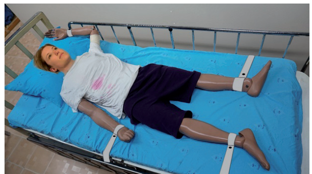
ภาพที่ 1 การผูกมัด 4 จุด

สำหรับเทคนิคของการผูกมัดที่ถูกต้องสำหรับการใช้ทั้งสายรัดข้อมือและเท้าร่วมกันนั้น (16) ควรจัดวางท่าทาง/ร่างกายของผู้ป่วยให้เหมาะสม โดยมีข้อคำนึงที่สำคัญ คือ ในท่านอนหงาย (supine position) ผู้ป่วยอาจเกิดการสำลักได้ ในขณะที่ท่านอนคว่ำ (prone position) ผู้ป่วยอาจเกิดการหายใจไม่ออก (asphyxiation) ขึ้นได้ สำหรับท่านอนหงายต้องให้ส่วนศีรษะของผู้ป่วยสามารถเคลื่อนไหวได้อย่างอิสระ และควรปรับเตียงส่วนบนให้สูงขึ้นประมาณ 30 องศา ถ้าเลือกใช้การผูกมัด 4 จุด (ภาพที่ 1) ควรจัดให้แขนข้างหนึ่งอยู่ด้านบน ขณะที่ยกอีกข้างอยู่ด้านล่าง และควรสลับด้านกันเป็นระยะ ในกรณีที่ใช้การผูกมัดแบบ 2 จุด ก็ควรเลือกผูกมัดแขนหนึ่งอยู่ด้านบนและผูกมัดขาในฝั่งตรงข้ามกัน ซึ่งก็จะทำให้สามารถสลับด้านกันได้เช่นกัน ในตำแหน่งของการผูกมัดบริเวณแขนหรือขานั้นต้องมีแผ่นรองคั่นระหว่างผิวหนังกับอุปกรณ์ ไม่รัดแน่นจนเกินไป หรือ หลวมจนเคลื่อนได้ ส่วนปลายอีกด้านของสายรัดต้องผูกยึดอยู่กับโครงเตียงที่แข็งแรงและไม่เคลื่อนที่ อยู่ในตำแหน่งที่ห่างจากการเข้าถึงของผู้ป่วย และต้องให้สามารถปลดได้อย่างสะดวกสำหรับกรณีฉุกเฉิน โดยห้ามใช้สายรัดหรือเงื่อนไขอื่นนอกจากนั้น เติงของผู้ป่วยควรอยู่ในตำแหน่งที่พยาบาลสามารถมองเห็นและเข้าถึงได้โดยง่าย